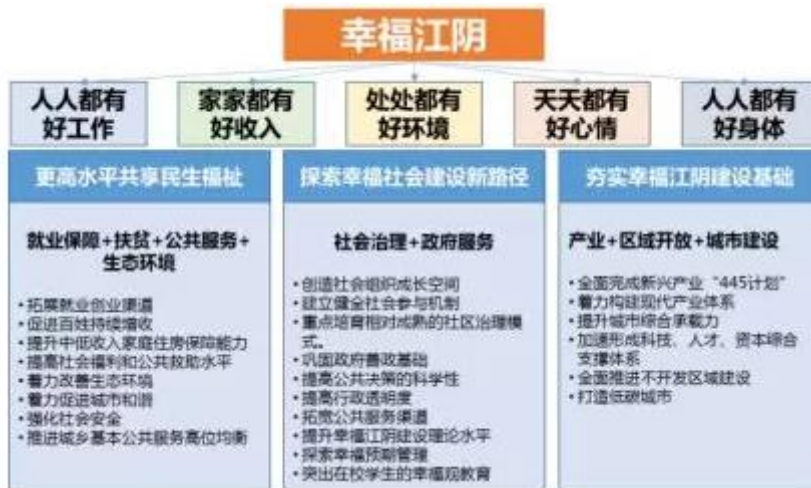
(b) 幸福江阴行动纲要框架