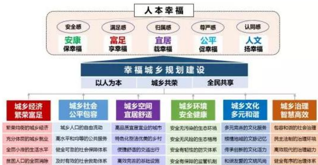
幸福城乡规划建设范式

幸福城乡规划建设应从经济、社会、空间、生态、文化和治理六个方面出发，全面系统提升城乡人居环境和服务水平，以此为手段和载体提升全体人民的安全感、满足感、归属感、尊严感和认同感，最终实现幸福感的综合提升。