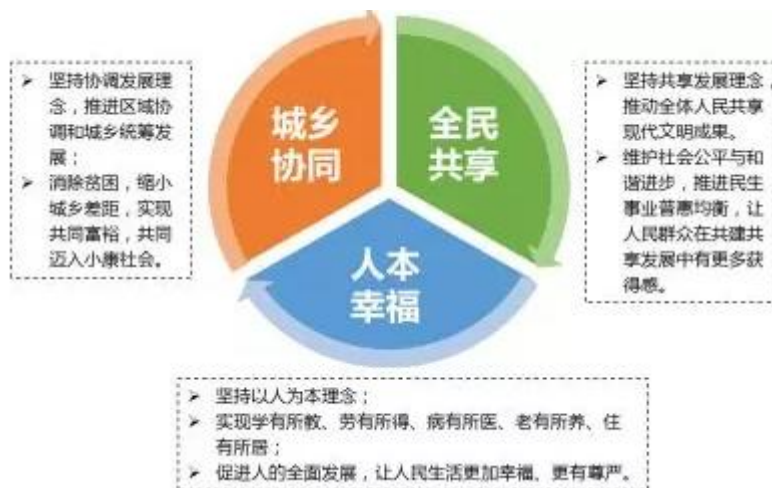
建设株洲城乡统筹发展幸福区的价值观及内涵

研究提出建设株洲城乡统筹发展幸福区应牢固树立和坚持“城乡协同、全民共享、人本幸福”的总价值观，以城乡统筹为手段、以民生幸福为出发点和落脚点，努力建设繁荣富足、和谐包容、安全健康、宜居品质、人文魅力的幸福新株洲。