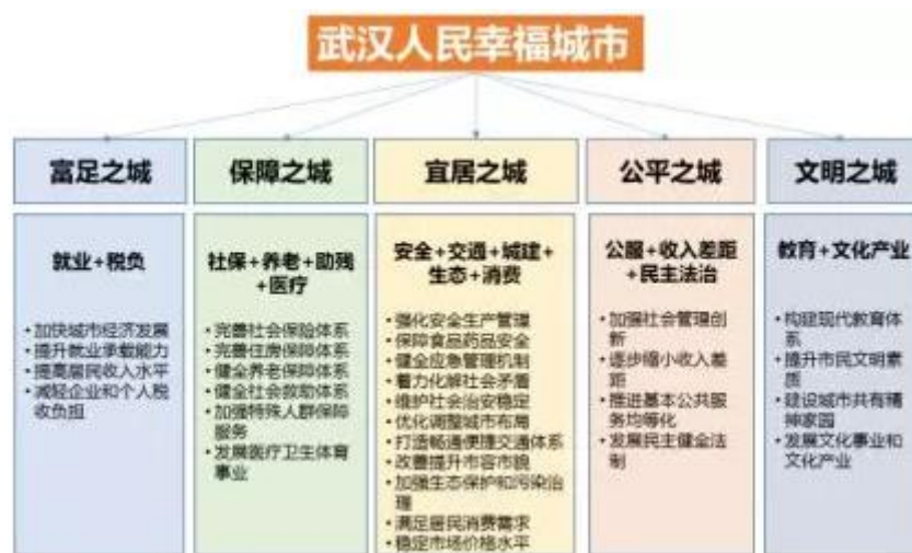
(a) 武汉市建设人民幸福城市规划框架

行动纲要和行动工程主要在实施层面，明确规划近期需要落实推进的工作和重大项目，并且明确具体实施的行政机构。例如从2009年持续至今的《建设幸福长春行动计划》，根据每年的民生发展重点，制定当年的行动计划。广州的《关于推进民生幸福工程的实施意见》针对外来务工人员群多的特征，着重提出了要“构建开放包容的异地务工人员服务体系”的行动策略。